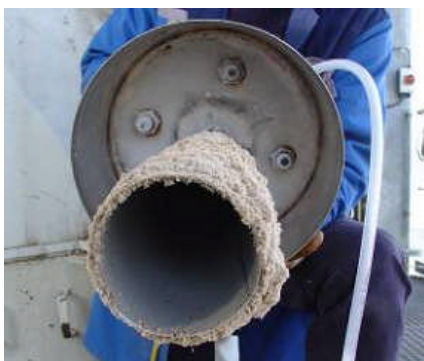
Antenne cône maintenue propre grâce au système d'insufflation d'air (0,5 bar)